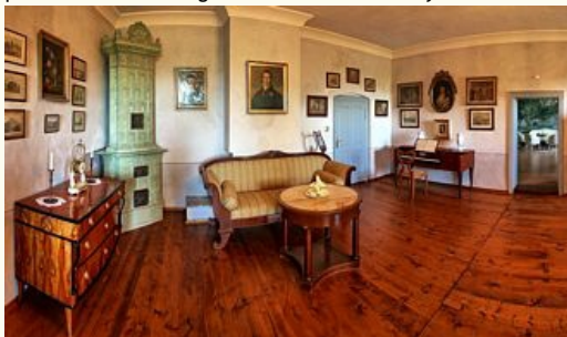
Jídlna - renesanční hodovní síň